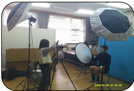
卒業写真撮影の様子…本格的です