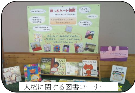
人権に関する図書コーナー

12月4日から10日は人権週間でした。この期間、出雲郷小学校も、「ほっとハート週間」と名付けて、子どもたち一人一人が、お互いを大切な存在だと認め合い、温かい気持ちにあふれる学級、学校にしていこうと、様々なことに取り組みました。