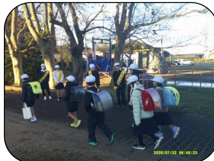
朝のあいさつ運動をがんばった生活委員会