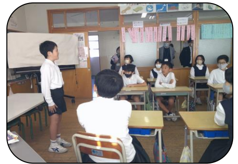
緊張したけどがんばったスピーチ活動