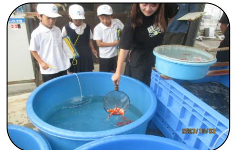
町探検の様子…地域から多くのことを学んでいます

出雲郷小学校に留守番対応電話が導入されました。これは、松江市教育委員会が策定した「教職員働き方改革推進プラン」に基づくものです。については、下記の時間は、音声ガイダンス対応となります。ご理解ご協力よろしくお願いいたします。