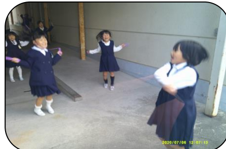
休憩時間の様子…みんなでおなわとび、楽しいね