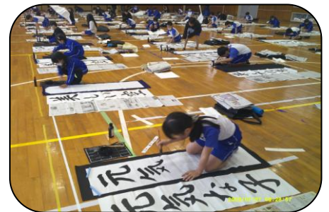
書初め練習会の様子…集中して書きました