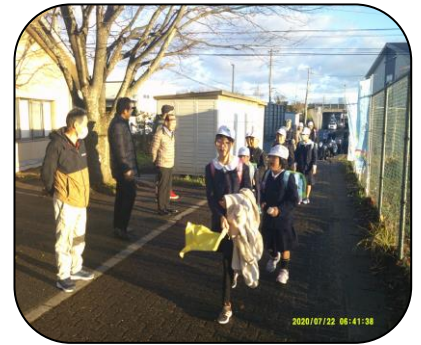
12月、2学期最後の学園あいさつ運動の様子

あだかえっ子発表会で、演奏やダンス、セリフをがんばった子、図画や版画などの作品作りをがんばった子、朝のスピーチをがんばった子、日々の自主学习をがんばった子、授業で発表をがんばった子、友達にやさしくしようとがんばった子、委員会活動で学校を良くしようとがんばった子・・・子どもたちそれぞれのがんばりをしっかり褒めたいと思います。