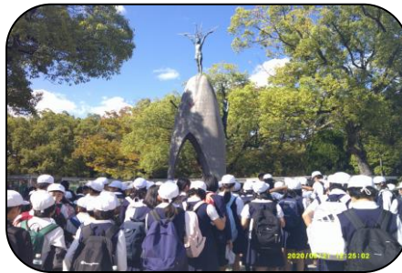
修学旅行の様子…みんなでおなわとび、楽しいね