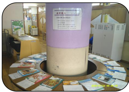
自主学习をがんばった子どもたちの自主学习ノートの展示