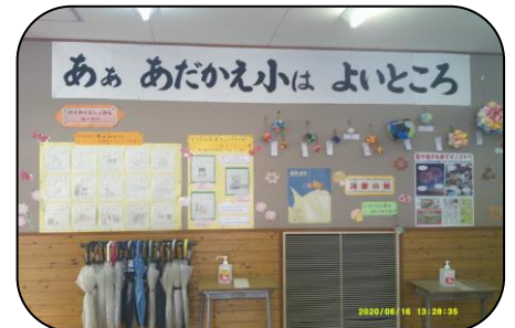
校内掲示の様子…キャッチフレーズを掲げています