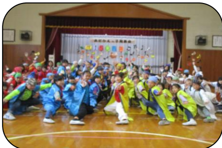
あだかえっ子発表会の様子…150周年をお祝いしました