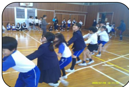
綱引き大会の様子…体育委員会が企画しました