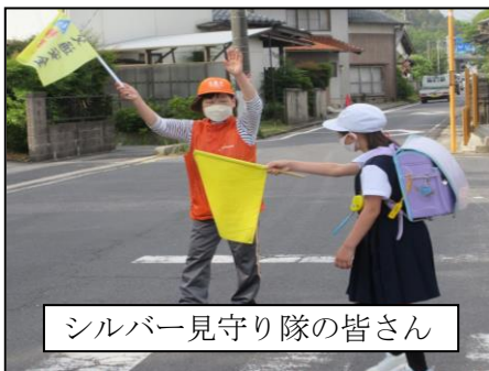
シルバー見守り隊の皆さん