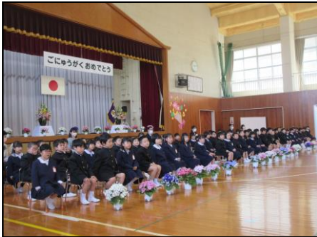
4月 80名の新生を迎え、474名の児童で今年度がスタート！