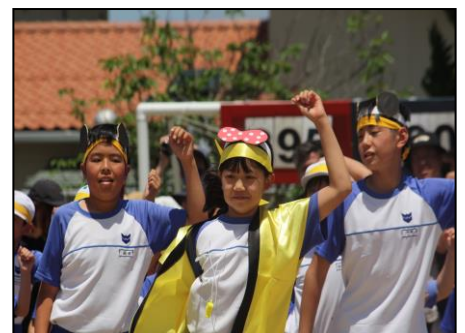
6月初め 6年生を中心に、学校が一つになったなかよし運動会