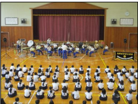
6月下旬 大迫力の生演奏、島根県警察音楽隊による演奏会