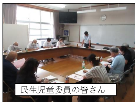
民生児童委員の皆さん