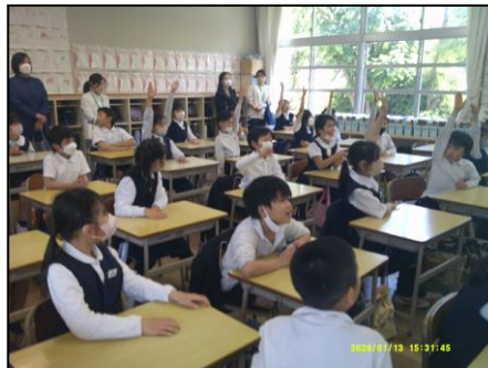
5月 たくさんの保護者の皆さんに来校いただいた学習公開日