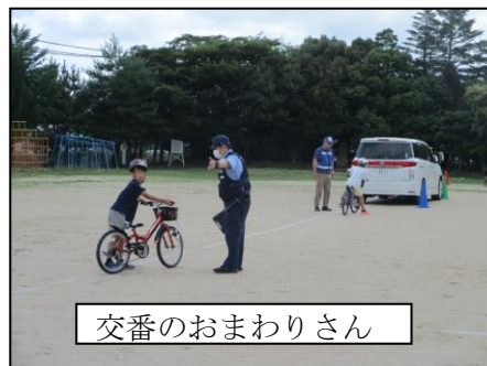
交番のおまわりさん