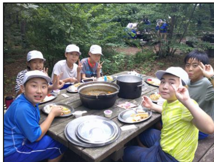
6月終わり 5年生、思い出に残る1泊2日、三瓶での宿泊研修