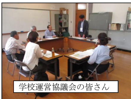
学校運営協議会の皆さん