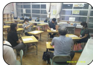
写真は、7/13に開催した地区懇談会の様子です。参加いただいた地区委員、民生委員児童委員、シルバー見守り隊の皆さん、ありがとうございました。