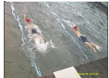
7月 大トリは3年生、しっかり泳ぎ楽しんだ水泳学習