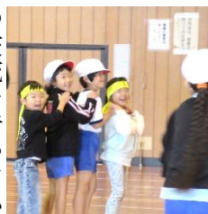
昨年度の1年生との交流より

今年度もさらなる幼小の交流を行っていきます。どうぞ、ご理解のほど、よろしくお願いたします。