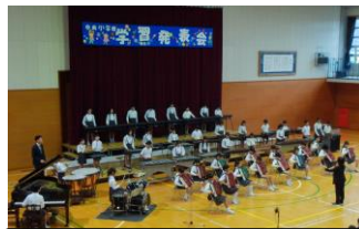
最後の学習発表会（6年生）