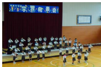
初めての学習発表会（1年生）