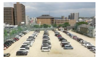
授業公開時の校庭駐車場

5月8日(金)、今年度最初の授業公開を計画しましたところ、たくさんの保護者の皆さまにお出かけいただきありがとうございました。次の日保護者の方からは「先生や友だちの話を聴く姿に成長を感じました」「学年が一つあがった学び方を実感しました」「授業に真剣に向かう姿勢に安心しました」などの声が届いていました。今年度本校のめざす「自分の言葉で語り、聴きあえる学級集団づくり」を基盤に、“対話を通して学びを深める授業”を目指していきたく思います。