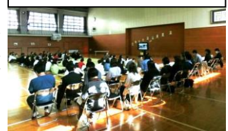
体育館での総会の様子

また、授業後には、体育館にてPTA総会および教育後援会総会(紙面決議)を行いました。校長からは学校経営方針(案)を説明しました。今年度は「一人一人のよさが発揮できる集団(チーム)づくり」を合言葉に掲げ、学級、学年、異学年、教職員、地域やPTAを含め、様々な集団においてチーム力を高めたいという願いを伝えさせていただきました。あわせて、給食費や給食着、登下校の安全についても話をふれさせていただきました。保護者の皆さまには引き続き本校の教育活動に対しご理解とご協力をお願いするとともに、年度末には取組を振り返り評価していただきますようよろしくお願いいたします。