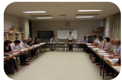
鹿島ふれあい学園地域推進協議会