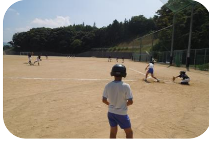
小中交流部活動体験