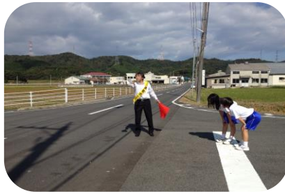
ロードレース大会