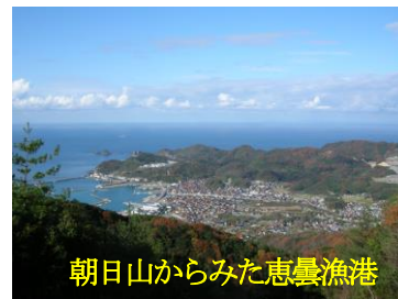
朝日山からみた恵曇漁港