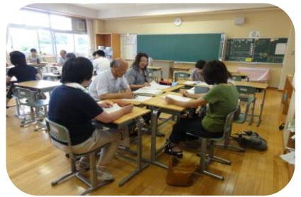
小中一貫教育部会