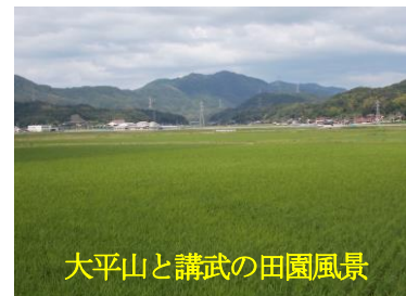
大平山と講武の田園風景