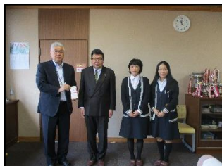
樋野電機工業有限公司様