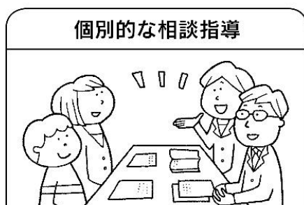
個別的な相談指導

学校給食は、児童生徒の健康の維持・増進、体位の向上を図り、望ましい食習慣と食に関する実践力を身につけるために重要な教材です。また、地域の文化や伝統に対する理解と関心を深めます。