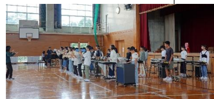
↑写真は壮行演奏会の様子です。

本番でこどもたちは、これまで練習してきた成果を県民会館大ホールのステージでしっかり表現しました。きれいで美しい合唱とリズムに乗った合奏に感動しました。そして、コツコツと努力し、力を付け、成長した5.6年生の姿をとてうれしく思いました。励ましやご声援をいただいた皆様、会場まで足を運んでいただいた皆様、本当にありがとうございました。※連合音楽会の様子は、山陰ケーブルビジョン（マープル）でテレビ放送されます。11月24日（日）～初回放送です。