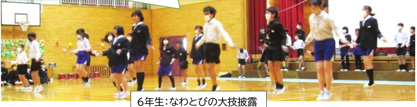
6年生:なわとびの大技披露

県教育長賞を受賞！ 5年生が総合的な学習の時間に取り組んできた中海流入河川調査において、中海の水質浄化や水環境の保全に貢献したとして、県教育長賞をいただきました。