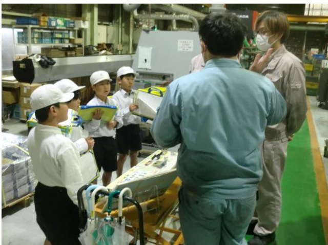
町探検でお世話になった地域の皆様