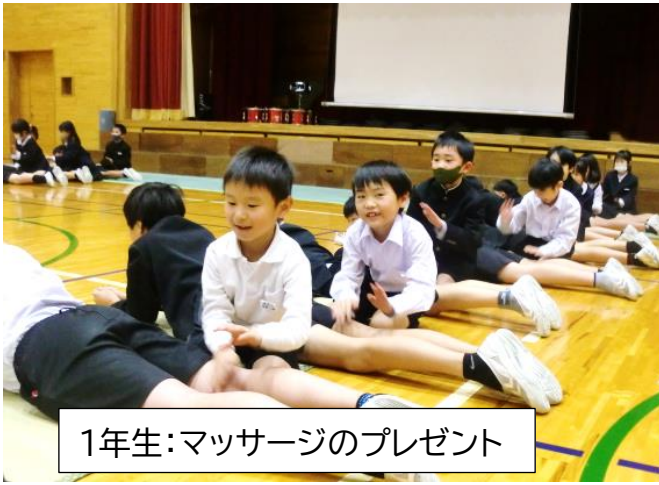
1年生:マッサージのプレゼント