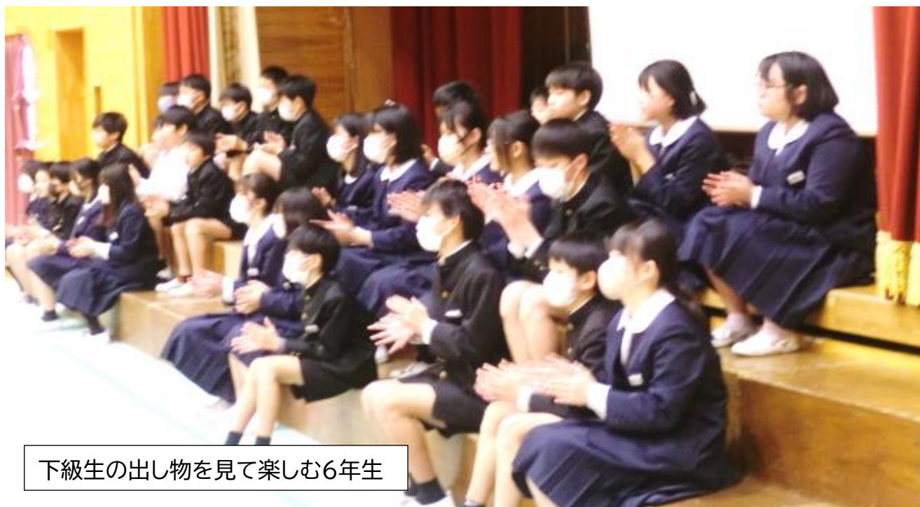
下級生の出し物を見て楽しむ6年生

5年生、全校を動かす初めての経験に戸惑いながらも乗り越え、会を成功させたことは、次期リーダーとしての自信になりました。最後にくす玉も見事に割れ、会は最高に盛りあがり幕を閉じました。5、6年生の保護者の皆様、当日はご多用の中ご来校いただきありがとうございました。