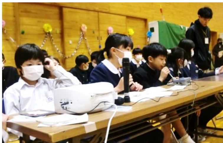
会を盛り上げる5年生