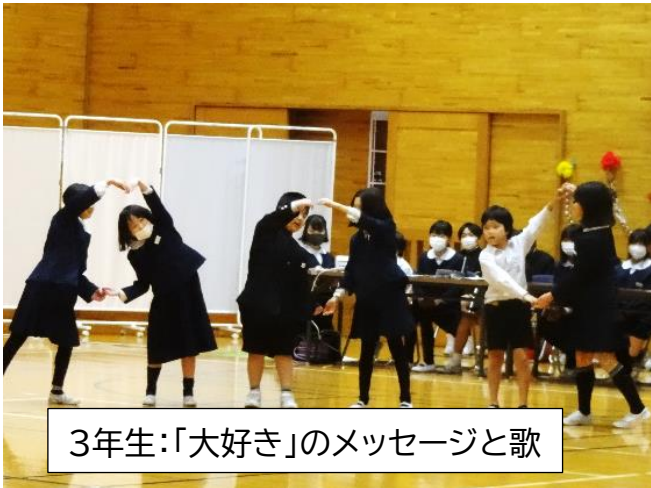
3年生:「大好き」のメッセージと歌