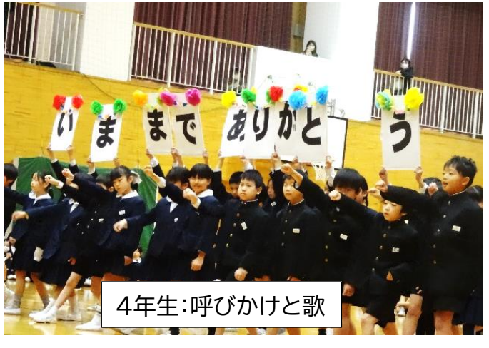
4年生:呼びかけと歌