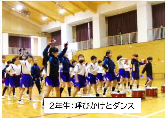
2年生:呼びかけとダンス