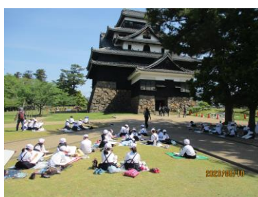
3年生の城山写生会