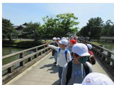
1・2年生のなかよし遠足

※5月8日からは新型コロナウイルス感染症もこれまでの、「新型インフルエンザ等感染症（いわゆる2類相当）」から、「5類感染症」になりました。それに伴い学校の感染予防対策についても見直しを図り、裏面欄のように変更しました。