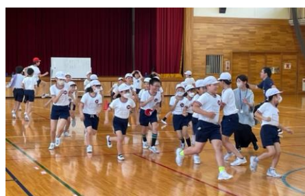
4・5・6年生のクラブ活動（屋内スポーツクラブ）