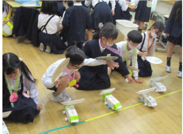
2年 生活科「おもちゃ教室」