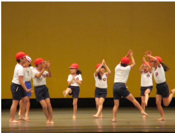
3年 体育科「表現運動発表会」