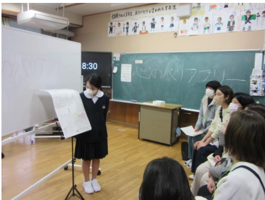
5年 総合的な学習「心のバリアフリー発表会」