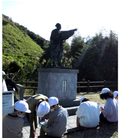
4年 社会科「佐陀川見学」