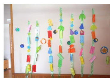
ひかり・こだまの七夕飾り