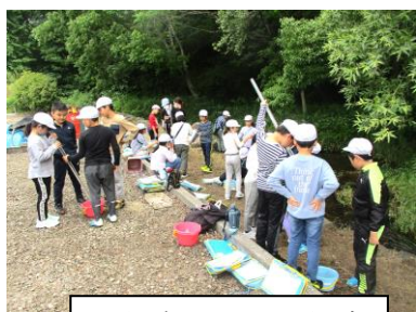
4年生の北田川調査