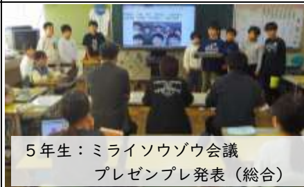
5年生：ミライソウゾウ会議 プレゼン発表（総合）