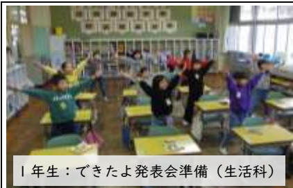
1年生：できたよ発表会準備（生活科）