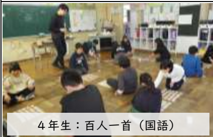
4年生：百人一首（国語）