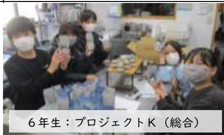
6年生：プロジェクトK（総合）