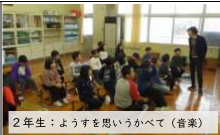
2年生：ようすを思いうかべて（音楽）