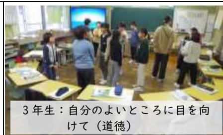
3年生：自分のよいところに目を向けて（道徳）