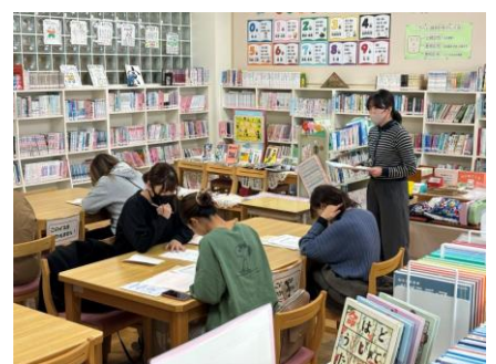
保護者の方は入学説明会