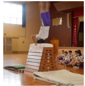
壮行演技会の様子