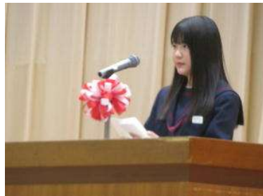
生徒代表 歓迎の言葉

皆さんは、昇降口に掲げられた今年の湖南中のスローガンに気づかれたでしょうか。今年の生徒会のスローガンは「Colorful 個性・笑顔・結束」です。このスローガンこそが、学校生