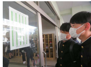
新学級発表(昇降口前)

伝えました。生徒の皆さんと教職員が力を合わせて、湖南中学校の学校教育目標『挑戦と協働』を心がけながら、学習活動や部活動、各種行事に取り組んでいきたいと思えます。