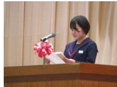
新入生代表 決意の言葉