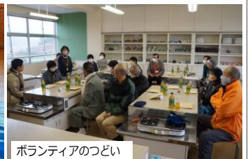
ボランティアのつどい