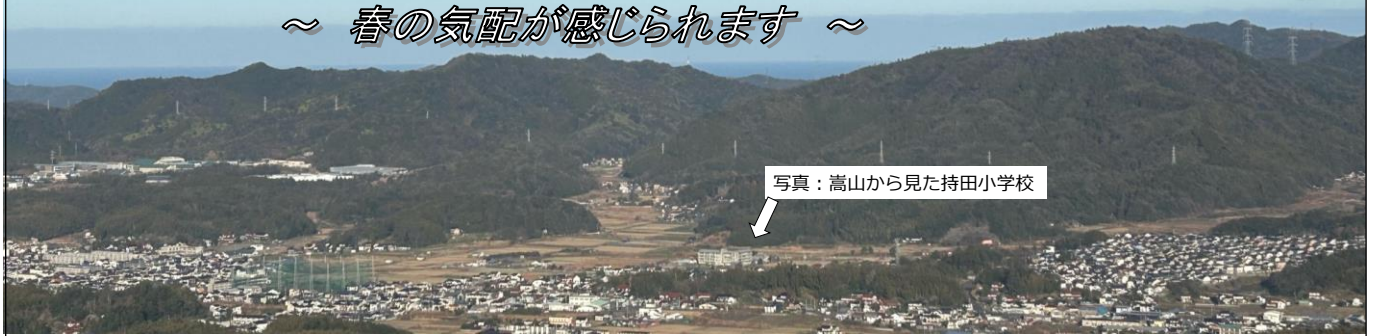
写真：高山から見た持田小学校