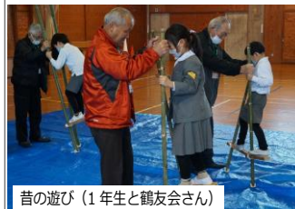
昔の遊び（1年生と鶴友会さん）

2月21日(水)に1年生と地域の皆様で昔の遊びの学習をしました。地域の皆様に教えてもらい、1年生はとてもうれしそうでした。また、この日はボランティアの皆様と「ボランティアのつどい」を開き、ボランティア同士の交流を深めました。