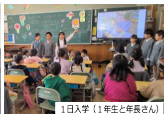
1日入学（1年生と年長さん）