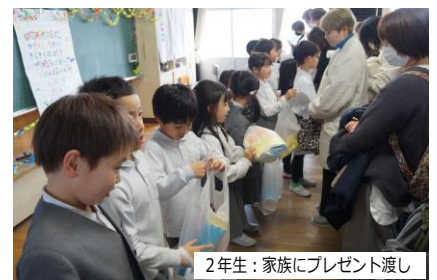
2年生：家族にプレゼント渡し

今年度はあとわずかとなりましたが、子どもたちが次の学年に向けて自信と希望をもって進級できるようにご協力をお願いいたします。