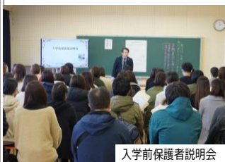
入学前保護者説明会

2月2日(金)に入学前保護者説明会と1日入学を行いました。小学校生活について保護者の皆様にお話し、年長さんと1年生と一緒に活動しました。少しでも安心して持田小学校に入学できるようにしっかりと準備していきます。