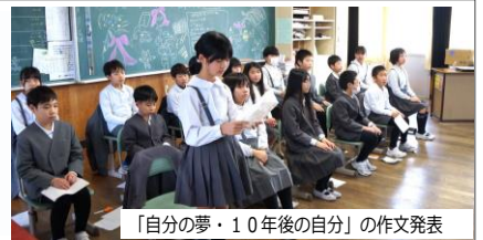
「自分の夢・10年後の自分」の作文発表

4年生は、授業公開日に「10歳を祝う会」を開き、10年間の成長を祝い、家族に感謝の気持ちを伝えました。自分の夢や将来のことを語る姿から、4月から高学年になるという意欲を感じ、とても頼もしく思いました。これからも自分で考え行動する力を伸ばしていきましょう。