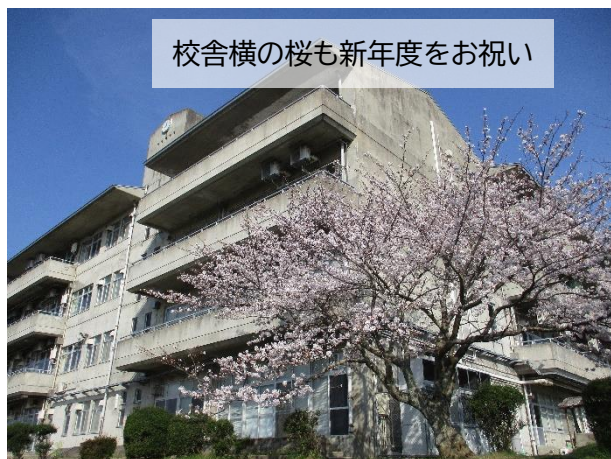
校舎横の桜も新年度をお祝い

やる気にあふれるこどもたちからパワーをもらい、私たち職員も力が湧いてきます。持田小学校が、笑顔にあふれ楽しくて幸せを感じることができる持田「笑楽幸(しょうがっこう)」となるよう職員一同力を合わせていこうと、思いを新たにしました。保護者、地域の皆様と一緒に、こどもたちを支えていきたいと思えます。今年度もどうぞご理解とご協力をよろしくお願いします。