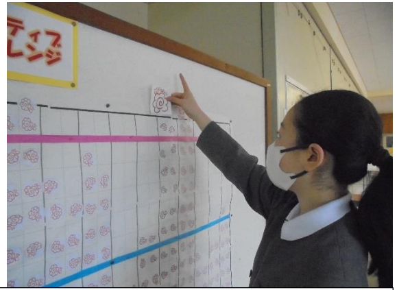
校長先生から頂いた大きな花丸シールを貼る児童