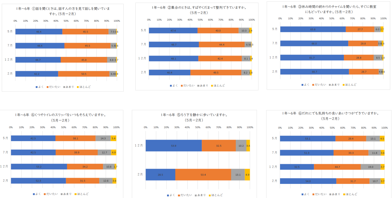
令和7年度 持田小学校SWPBS全校児童アンケート結果（5月・7月・12月・2月） n=全校児童数

「くつやトイレのスリッパをそろえる」「ろう下を静かに歩く」（追加で実施しためあて）は、実態として確実に良くなっているが、児童の意識が高まったことにより児童自身の基準が高くなったことで、全体的に肯定的回答が減ったと考えられる。