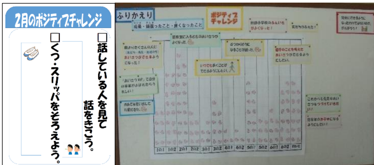
全教室に掲示したポスターと児童昇降口に掲示した一覧表

自分のクラスだけでなく他学級のシールの状況を見て「妹のクラスも頑張っているな」「このクラスは高い目標で頑張っているんだな」「自分達ももう少し頑張ろう」などと言いながら意欲を高める児童の姿を見受けることができた。