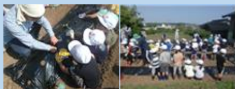
6月1日・6日ののはな・1年生さつま芋苗植え

この他にもミシンボランティアさんなどたくさんお世話になっています。続きはHPへ。