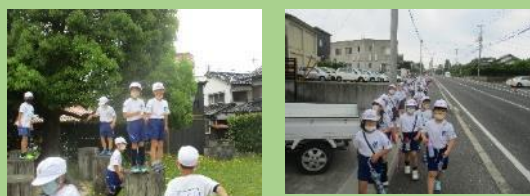
5月26日・6月2日 2年生まちたんけん

自分の住む地域やそこに住む人への愛着やほこりは、そこに住む自分の自尊感情につながります。