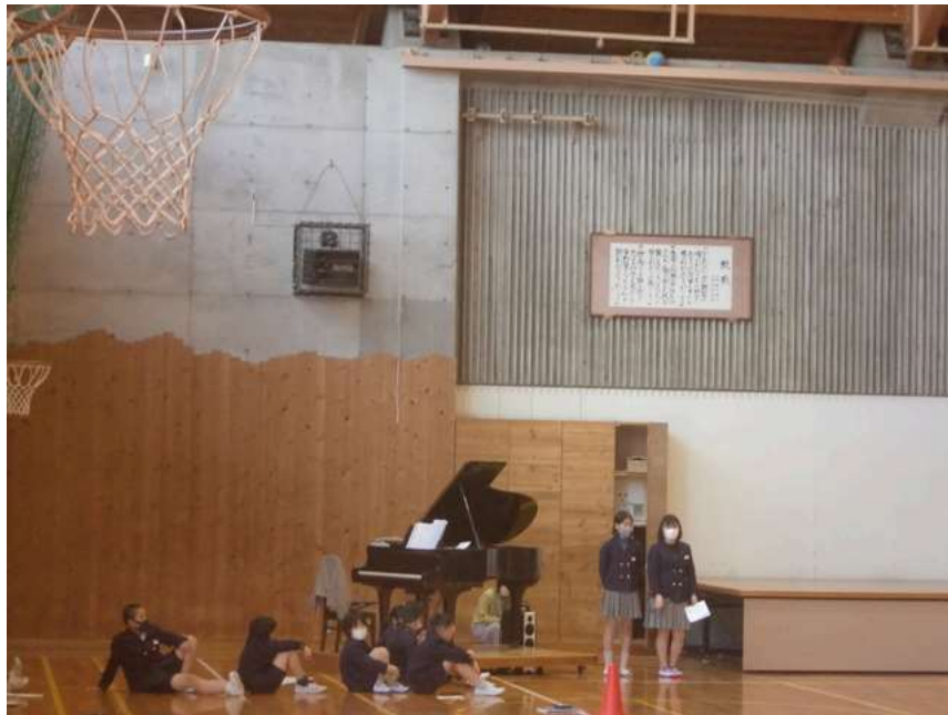
全校で今月の歌を歌います。