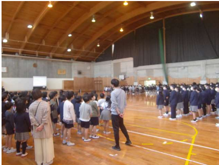
続いて大庭小学校クイズ。 1年生は77人である。○か×か？