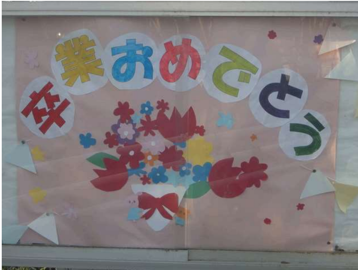
朝、校門で6年生のあいさつ

運動担当の児童が、「今日で最後のあいさつ当番・・・」とつぶやきました。 卒業式の月曜日は、5年と6年だけが登校なので、6年生と通学班でくるのも明日が最後です。 残す日々が少なくなるほど、それがかげがえのないものに思えてきます。