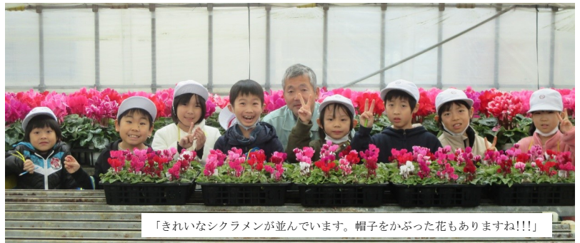
「きれいなシクラメンが並んでいます。帽子をかぶった花もありますね!!!」

1・2年生が、土居地区の松江花園さんを見学しました。見学中の表情は、新聞記者そのものです。1年生は絵で、2年生は言葉を中心に、知り得た情報をメモしていました。ビニールハウスはシクラメンの出荷の時期で、きれいな花がたくさんありました。種類の