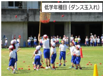
低学年種目(ダンス玉入れ)