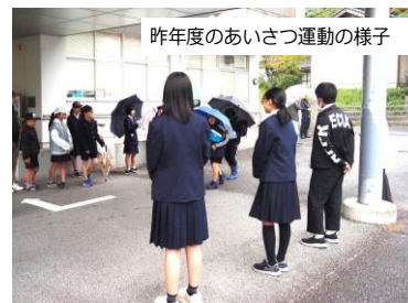
昨年度のあいさつ運動の様子

鹿島ふれあい学園では、教職員が参加する「夏季合同研修会(7/30)」「人権教育授業研究会(10/20)」にて研修を深めるとともに、学園内の教職員の連携を図ります。また、小学校3校の交流を深めるために、「5年生の連合宿泊研修」「6年生の連合修学旅行」を実施します。11月には、3校の6年生が鹿島中学校に集まって行う授業見学・部活動体験を計画しています。また、年間2回「学園教育推進会議」を開催し、学園の課題や子どもたちへの支援について検討していきます。