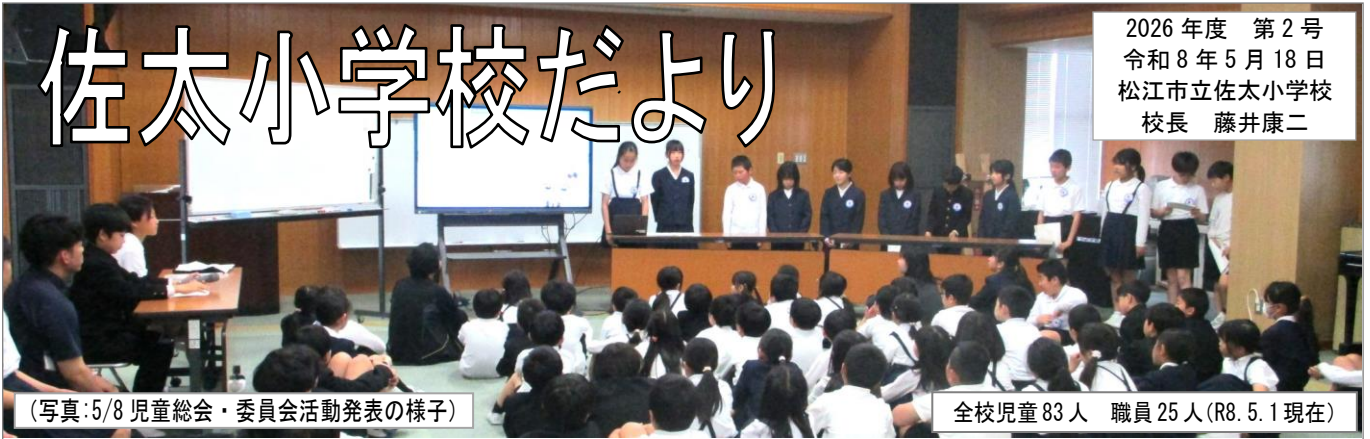
(写真:5/8 児童総会・委員会活動発表の様子)