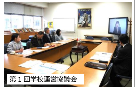
第1回学校運営協議会

4月30日(木)、第1回学校運営協議会を開催しました。委員の皆様には、教育長メッセージのビデオ視聴後、校長より学校経営方針を説明し承認をいただきました。今回の協議では、「こどもの学び」「学校の働き方改革」等が話題になりました。これからの教育課題を解決するには、地域や様々な関係機関との連携が欠かせません。5人の委員の皆様には、今後それぞれの立場から学校運営にお力添えをいただきます。