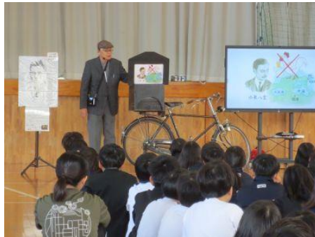
開校記念日(4月20日)全校朝礼より