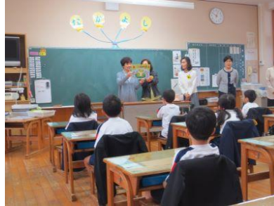
【交通安全を願って】