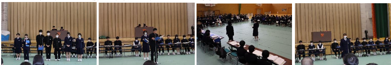
1月17日(水)新旧の生徒総会の様子です

皆さんが、自分の成長だけでなく、友達や家族とともに成長できる「優しい人」となれるように、がんばってくれる1年となることを願って、初めのあいさつとします。