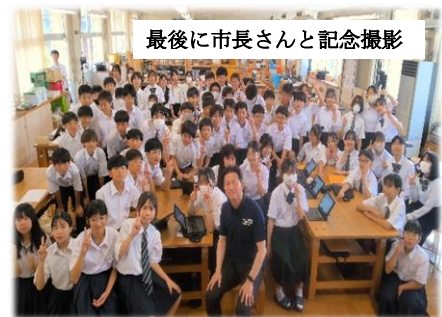
最後に市長さんと記念撮影

授業公開日と重なり、混乱を避ける意味もあって、事前には7年生の生徒と保護者、教職員にしかお伝えしませんでした。訪問後は、松江市のSNSでも掲載をされたようです。