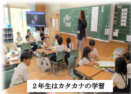
2年生はカタカナの学習

私としては、ご覧いただいた授業はもちろん、午前中に見た日常の授業での姿が印象に残りました。2年生の野菜づくりや3年生理科の学習など、みんなが前向きに取り組んでいる姿がありました。