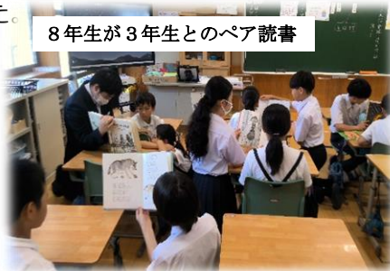
8年生が3年生とのペア読書