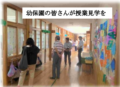
幼保園の皆さんが授業見学を

卒園式から3ヵ月余り。6月18日に、保幼小連絡会がありました。保育園、幼稚園の先生方が、学園の1年生がどんな勉強をしているのか、どのように勉強しているのかを、ご覧くださいました。来られる前から「楽しみにしています」とお聞きしていましたが、1年生のがんばっている姿を見て、感激しておられました。この日は、玉湯地区民生児童委員協議会の学校訪問もありました。こちらの会議でも、1年生が学習に向き合って真剣に取り組み、成長している姿をほめてくださいました。