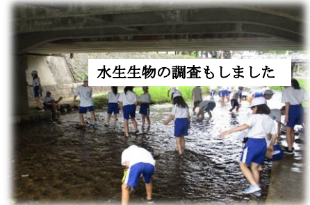
水生生物の調査もしました

こどもたちは総合的な学習の時間で「玉湯川はきれいな川なのかどうか」について学習を進めています。学習の入り口として玉湯川にみんなで探検に行き、川にいる生き物や植物を見に行きました。そして、その探検で発見した生き物や植物、水質検査から玉湯川はきれいな川なのかどうかを考えています。これから、玉湯川にいる生き物の特徴について調べ、玉湯川の実態に近づいていければ(後略)…。