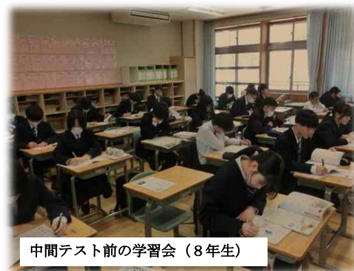
中間テスト前の学習会(8年生)