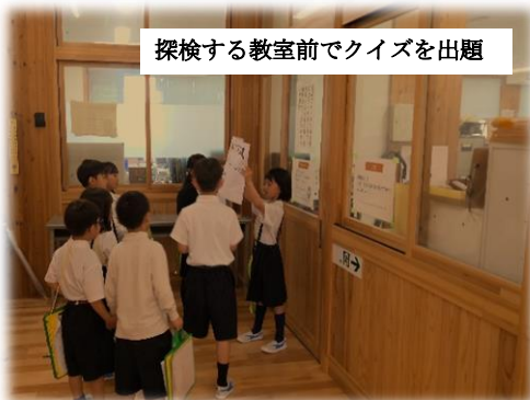
探検する教室前でクイズを出題

5月16日(金)、2年生が1年生をリードしながら、学校たんけんが行われました。1年前には、ドキドキ、オロオロしていた2年生です。そんなみんなが1年生を連れて、クイズを作って出題したり、始めの会や終わりの会を堂々と進行したりする頼もしい姿を見て、その成長ぶりを実感しました。