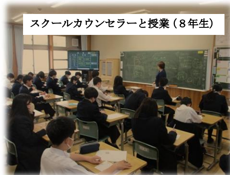
スクールカウンセラーと授業(8年生)

今年度も、地域に出かける生活科や社会科、総合的な学習の時間、児童生徒会活動などたくさんお世話になります。学園のみならず、町民みんなで「地域の宝」であるこどもたちを、どうぞ温かく見守っていただきますよう、よろしくお祈りします。