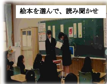
絵本を選んで、読み聞かせ