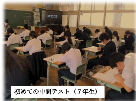
初めての間テスト (7年生)

といった前向きなコメントが多くみられました。これから1年間、道徳の授業でも、学校生活の中でも、今日の気持ちを大切に、自分の考えを深めながら行動していきましょう。 (7年学級だより)