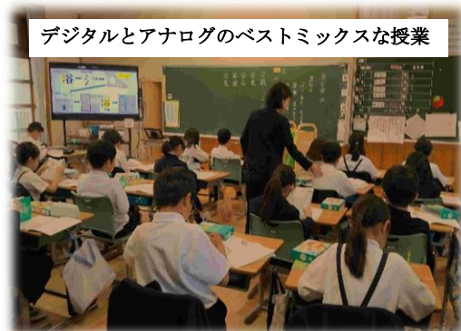
デジタルとアナログのベストミックスな授業

今年度は、PTA総会をオンライン形式として簡素化に努めました。また、学年・学級懇談会を開催することで、担任や学年主任と直接話をしていただき、少しでも学校や児童生徒の様子を保護者の方向士で情報共有できればと考えました。いかがでしたでしょうか。今後も、気軽に声が掛け合える雰囲気のある学園にしたいと考えています。ご協力をよろしくお願いします。