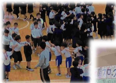
↑ 前期ブロック集会 → で活躍した4年生の 話題は、HPでも紹介