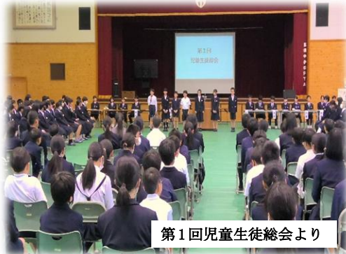
第1回児童生徒総会より

今年の生徒会スローガン「革新、は、変化することをポジティブに捉え、よりよい学園づくりをめざす、すてきな考え方だと思っています。児童生徒に、「いろいろな場面において変化することを積極的に受け入れ、成長し続ける教師でありたい」と考えさせられています。