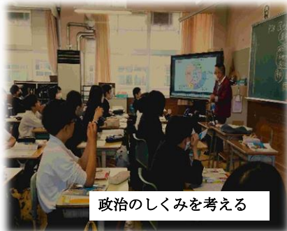
政治のしくみを考える