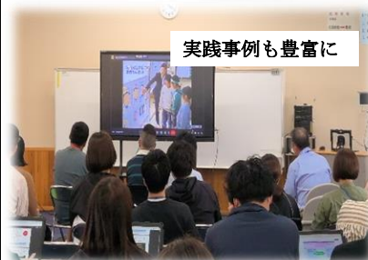
実践事例も豊富に