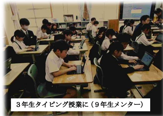
3年生タイピング授業に(9年生メンター)

いよいよ体育祭に向けての活動もスタートします。社会性やリーダーシップ、思いやりと多様性を理解し、尊重する力を養っていくことが必要になってきます。それらが、目に見える形となって一人ひとりの『行動』に表れることを期待しています。学年全体でさらに上をめざす雰囲気を作り、学園の顔になっていきましょう！ (9年学年だより)