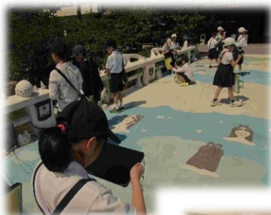
↑ 温泉街をまち探検 (3年生)