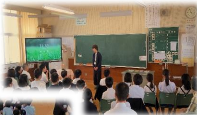
→ ストーリーテリング を楽しむ(5年生)