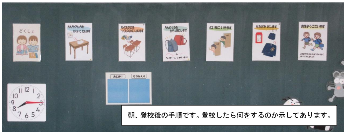
朝、登校後の手順です。登校したら何をするのか示してあります。