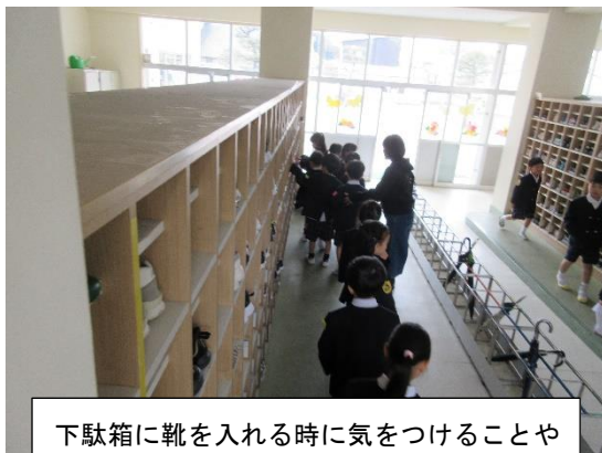
下駄箱に靴を入れる時に気をつけることや靴の向きなど、手順を教えています。