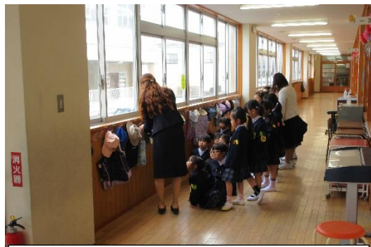
帽子や持ってきた荷物などをどのようにかけるか、手順や引っかける順番を教えています。

写真は1年生の取り組みですが、これは1年生に限った話ではありません。学習場面でもいろいろな学校生活の場面でも、〇〇ができなくて困っている子がいます。こういう子は本来できる力があるにもかかわらず、どうやっていいのか手順を知らない、やり方や方法がわからない、もしくはやり方や方法が定着していないなどの理由が考えられます。まずは、学習場面も含め、学校では子どもたちにしっかりと手順ややり方を教えていくことを大事にしたいと考えています。また、手順ややり方を教えることで「できる」だけでなく、子どもたちの「安心」にもつながると考えています。さらに、その安心が次への（未来への）主体的な取り組みや挑戦にもつながっていくことと思います。この安心を我々教職員、大人がつくり、支えていきたいと考えています。もしかすると、この手順を教えることは、ご家庭でも同様なことが言えるのかもしれない。例えば、家での仕事やお手伝いにもつながるように思います。料理をすること、料理を手伝うことも、お風呂掃除も、ふとんをたたむことなども、きちんと手順を教えることが大事なのだと思います。手順を教えることで、きっとできることも増えていくはず。手順を教えて、きちんとできた時には、がんばりや取り組みを認め、誉めていくと子どもたちも更にがんばります。是非、ご家庭でもこの「手順を教えること」を意識していただくと喜びます。（これは、ご家庭で何らかの家庭の仕事、お手伝いを通して、家族の一員としての自覚を育てていただきたいという私の思い、願いからです。）