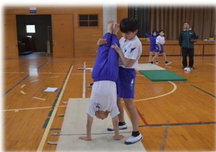
＜6-2 体育 原 T＞