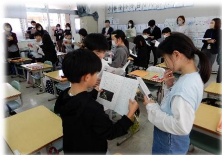
＜3-3 国語 北浦 T＞

11月後半から校内研究授業がたくさん行われ、互いに授業を参観し合い、協議することによって切磋琢磨する教職員の姿がありました。子どもたちの力を伸ばすためには、我々教職員は授業力をアップし、授業づくりをアップデートする必要があります。授業力の向上は、私たち自身の永遠の課題でもあり目標でもあります。子どもたちの力を引き出し伸ばすための手立てや、授業づくりの手法について、共有したとを各々の実践に活かしていきたいと思います。（他のクラスでも研究授業を行っています）