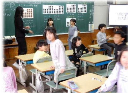
＜2-2 算数 蔵増 T＞