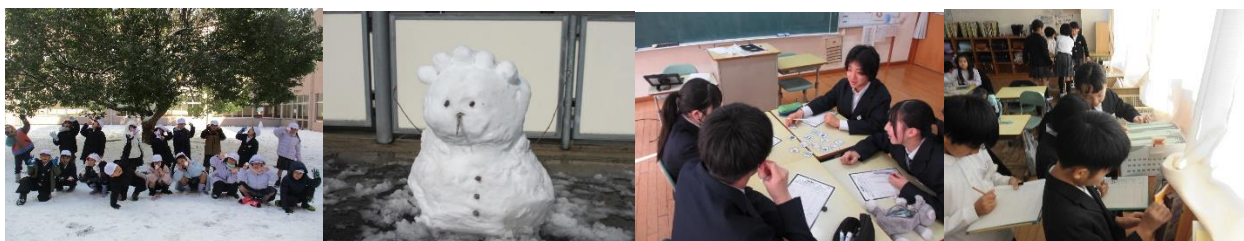
↑降雪が続き、雪遊びも楽しみました。