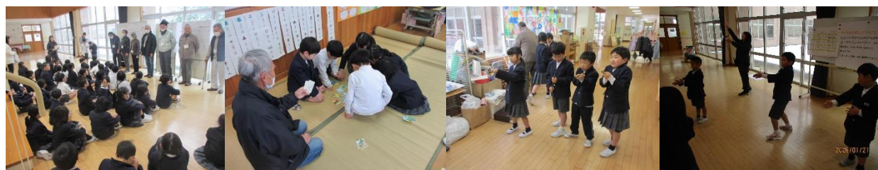
↑1、2年生は地域の方を講師にお招きして、竹とんぼやかかるたなど、「昔のあそび」を楽しみました。