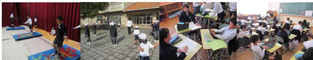
↑前期課程は、なわとびの練習に励んでいます。