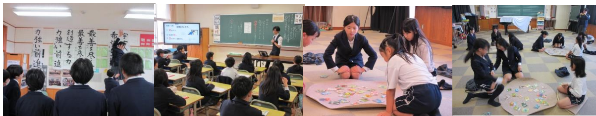
↑地震の被害もなく、無事3学期をスタートしました。